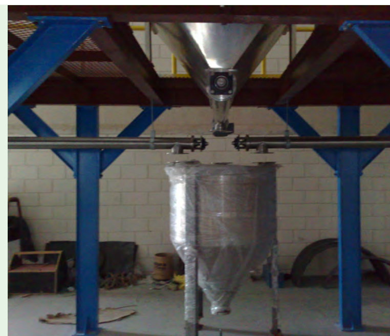
Dosagem em Silo Balança ▲

Nunca se falou tanto em produtividade, em diminuição dos custos de produção e em preservação do meio ambiente. Aliado a todos estes conceitos, não podemos esquecer de um outro não menos importante que é o da sustentabilidade.