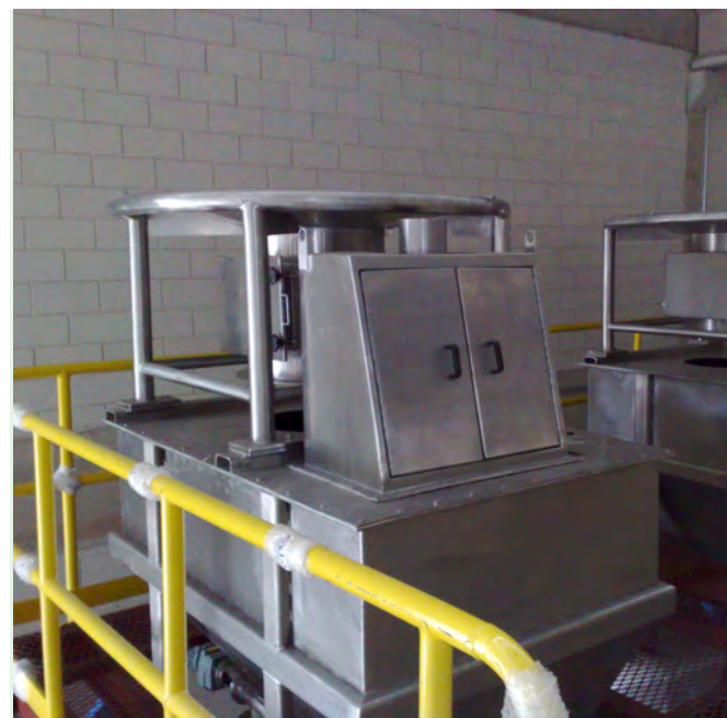
▲ Manuseio de matérias primas sólidas