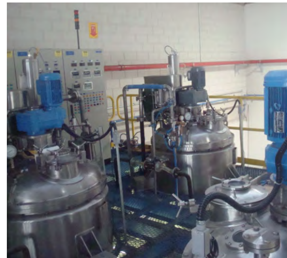
Reatores de alta viscosidade ▲

Também podemos estudar soluções customizadas para outros problemas, desde processos produtivos até controle e gerenciamento de resíduos, onde se fizer necessário.